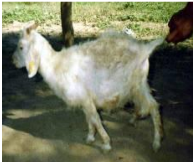
Foto N° 14. Abdomen abultado en un cabrito con síntomas de teniasis.

Con referencia a las ectoparasitosis, las de mayor importancia fueron la pediculosis y la ixodidosis. (Ver tabla N° 2). Los ejemplares de piojos recolectados fueron clasificados en el orden anopluros con el genero Linognathus especie stenopsis conocido como piojo chupador azul y en el orden malófagos Damalinia ( Bovicola ) caprae piojo masticador rojo. . (Ver fotos N° 15 y 16). Observación microscópica con objetivo 5X.