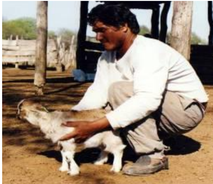
Foto N° 22. Falta de desarrollo en un cabrito con Bocio. Discusión y Conclusión:

Del listado de enfermedades que afectan a los caprinos la de mayor importancia fue la desnutrición, que se presentó en un 100% de las majadas con prevalencias y grados de desnutrición variables a nivel intra predial en las diferentes categorías de animales y estados fisiológicos reproductivos. Como factores desencadenantes de un estado nutricional deficiente se citan a la insuficiente disponibilidad de recursos forrajeros, alta carga animal, el pastoreo multiespecie en la misma parcela, sumada a esta situación se observó que la totalidad de las unidades productivas estudiadas no presentan cercos especiales para la contención de los caprinos. Esta falta de infraestructura posibilita el libre pastoreo, con recorrido de largas distancias que demandan un gasto de energía adicional y dan origen a un desbalance entre lo que ingiere en el pastoreo y el consumo de energía por el recorrido. También se pudo constatar la falta de implantación de pasturas y los