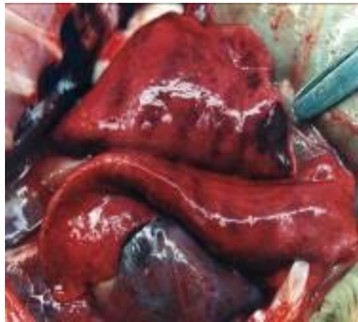
Foto N° 2. Pulmón con le...