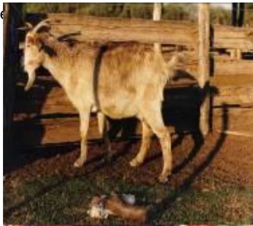
Foto N° 3. Aborto en cabra por brucelosis, en una cabra con neumonía Infectada por Brucella melitensis