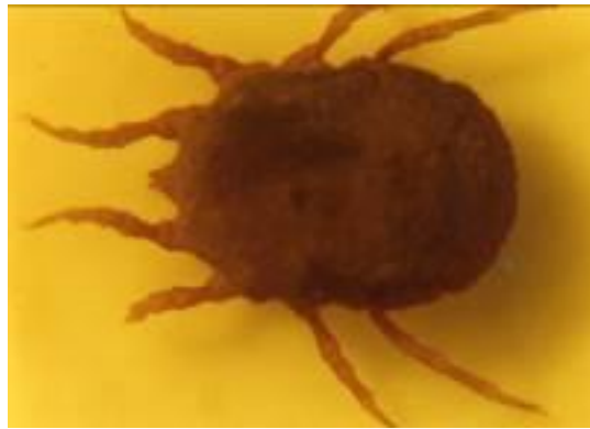
Foto N° 18. Adulto de Ornithodoros rostratus . Con respecto a la nutrición y productividad la evaluación de la condición corporal arrojó un promedio general de 2.3, equivalente a una condición corporal deficiente, estos resultados determinan que la enfermedad más importante es la Desnutrición y en segundo lugar el Hipotiroidismo o Bocio, detectándose en un 26 % a 32% de las majadas en estudios, en las diferentes unidades epidemiológicas. (Ver cuadro N° 3 y fotos N° 19, 20, 21 y 22).

Dentro de las pérdidas de productividad la mortalidad perinatal osciló entre el 11% y 41%. Se estableció que las causas principales de mortandad de cabritos en el primer mes de vida fueron las neumonías, inanición e hipotermia.