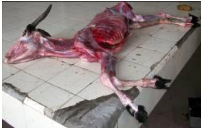
Foto N° 10. Cabra con gastroverminosa aguda. Condición corporal muy deficiente, C.C. 1