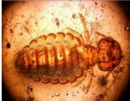
Foto N° 16. Piojo Masticador. En los animales infestados por garrapatas los ejemplares recolectados fueron clasificados dentro de la familia ixodidae Rhipicephalus microplus y Amblyomma sp.

Por otro lado se observaron estadios adultos y juveniles de garrapatas de la familia Argasidae Ornithodoros rostratus en el suelo de corrales de caprinos de la Unidad Epidemiológica del Departamento Ramón Lista, no detectándose la infestación en los animales durante el examen clínico de la piel (ver foto N° 17 y 18).