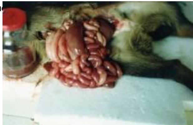
Foto N° 8. Lesiones intestinales en cabrito con enterotoxemia. La endoparasitosis más importante por la frecuencia de presentación clínica y pérdidas económicas ocasionadas, fue la Gastroenteritis Verminosa, cuyos agentes causales de mayor prevalencia fueron Haemonchus contortus , Trichostrongylus axei , Strongyloides papillosus y Trichuris ovis , detectándose la infección en un 100% de las majadas de las unidades epidemiológicas del Dpto. Formosa y Patiño y un 15% en el Dpto. Ramón Lista.

Las infecciones por coccidios fueron detectadas en un 89,5 % en el Dpto. Formosa y un 44 y 56 % en Patiño y Ramón Lista, mientras que las infecciones a moniezas fueron del 42 %, 28 % y 32 % para Formosa, Patiño y Ramón Lista.