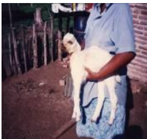
Foto Nº 1. Ectima Contagiosa

CUADRO Nº 1: ENFERMEDADES INFECCIOSAS En la información obtenida de las encuestas realizadas durante las visitas a los productores, se pudo apreciar que una de las enfermedades de importancia creciente es la Brucelosis, por el aumento de casos diagnosticados en personas relacionados con la crianza de cabras, coincidentemente con las notificaciones por parte de los productores sobre la presentación de abortos. El 98% de los productores describen la presentación de esta afección, sin poder estimar los porcentajes de cabras con esta problemática y las causales de la misma.