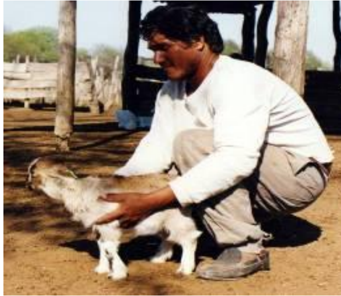
Foto N° 22. Falta de desarrollo en un cabrito con Bocio. Discusión y Conclusión:

Del listado de enfermedades que afectan a los caprinos la de mayor importancia fue la desnutrición, que se presentó en un 100% de las majadas con prevalencias y grados de desnutrición variables a nivel intra predial en las diferentes categorías de animales y estados fisiológicos reproductivos. Como factores desencadenantes de un estado nutricional deficiente se citan a la insuficiente disponibilidad de recursos forrajeros, alta carga animal, el pastoreo multiespecie en la misma parcela, sumada a esta situación se observó que la totalidad de las unidades productivas estudiadas no presentan cercos especiales para la contención de los caprinos. Esta falta de infraestructura posibilita el libre pastoreo, con recorrido de largas distancias que demandan un gasto de energía adicional y dan origen a un desbalance entre lo que ingiere en el pastoreo y el consumo de energía por el recorrido. También se pudo constatar la falta de implantación de pasturas y los productores realizan la crianza de caprinos teniendo como única fuente alimentaría prácticamente a los recursos del monte.