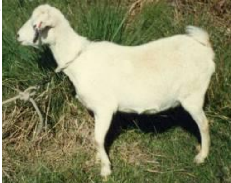
nte. C.C. 1.