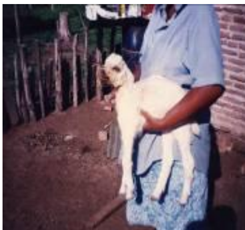
Foto Nº 1. Ectima Contagiosa

CUADRO Nº 1: ENFERMEDADES INFECCIOSAS En la información obtenida de las encuestas realizadas durante las visitas a los productores, se pudo apreciar que una de las enfermedades de importancia creciente es la Brucelosis, por el aumento de casos diagnosticados en personas relacionados con la crianza de cabras, coincidentemente con las notificaciones por parte de los productores sobre la presentación de abortos. El 98% de los productores describen la presentación de esta afección, sin poder estimar los porcentajes de cabras con esta problemática y las causales de la misma.