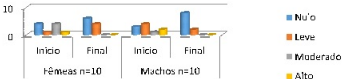
Gráfico 2. Niveles de infección parasitaria al inicio y final de la suplementación de las hembras y machos. En el gráfico 2, se puede observar el nivel de infección para los animales con nemátodos gastrointestinales en el inicio y final de la suplementación de las hembras y machos; quiénes tuvieron diferentes niveles de comportamiento como sigue:

En el inicio de la suplementación las hembras presentaron cuatro animales con nivel moderado seguido de un animal en el nivel leve y otro en el nivel alto, cuatro en nivel nulo. Con relación a los machos cuatro animales se situaron en nivel leve, dos en alto, uno moderado y tres nulos.