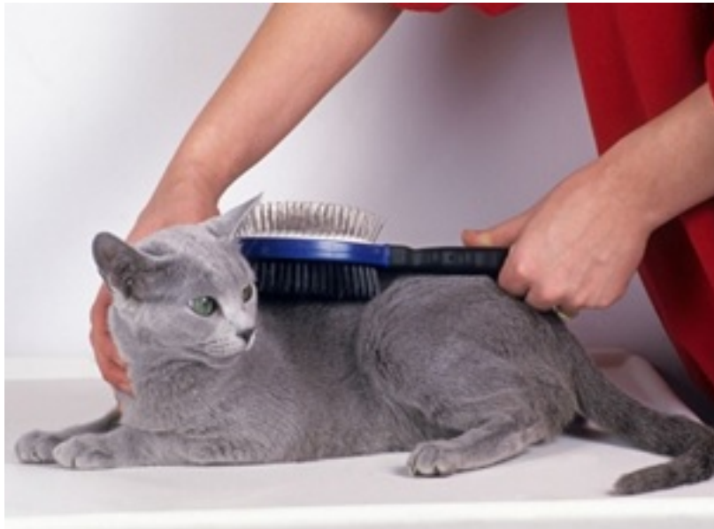
Figura 3.- Ejemplo del correcto cepillado para los gatos En cuanto a la incógnita de que si se debe bañar a nuestro gato, esto solo es necesario en el caso de enfermedades de la piel, posteriormente el secado del pelo debe ser rápido y a conciencia y no se debe soltar al animal hasta que esté totalmente seco (Brehend, 2003).

Cepillado y mantenimiento del pelo del gato: El gato está consignado por completo al cuidado del pelo y lo más básico es lavar y peinar, esto lo hace con su lengua, sin embargo, tales cuidados del pelo deben formar parte de su programa diario de aseo, para lo cual se utilizan cepillos en púas separadas para deshacer los nudos con cuidado (Meadows y Flint, 2003) (Figura 3).