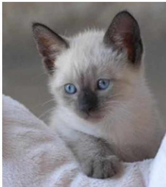
Figura 1.- Gato Siamés adquirido de criadero que es cariñoso y juguetón, al igual que un gato de raza pura. Elección del gato de acuerdo al carácter del animal:

Elección de la raza de la mascota: Hay docenas de razas, algunas sin pelo o incluso sin cola, como resultado de mutaciones genéticas, y existen en una amplia variedad de colores. Antes de adoptar un gato, se debe analizar bien si se requiere un gato de raza pura, con Pedigrí o un gato sin papeles. Un Gato no es más valioso por el hecho de los costos. Un gato abandonado en un refugio de proporcionar a una familia más alegría y cariño como un gato de raza pura (Figura 1). También son animales que pueden asimilar algunos conceptos, y ciertos ejemplares pueden ser entrenados para manipular mecanismos simples (Martínez, 2006).