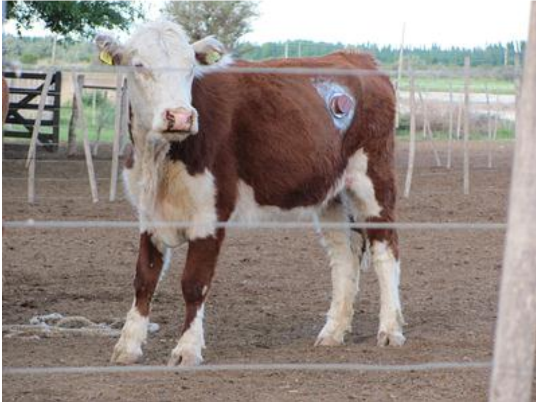
Foto 11 La recuperación del animal fue buena, recobrando el apetito a las 6 horas posteriores a la cirugía, lo cual dependió del grado del retorno de la motilidad ruminal. Superado ese lapso la vaca tuvo libre acceso al ensilado de maíz, en un cuadro con escaso forraje. Se aplicó enrofloxacina LA a las 48 hs. y curabicheras y cicatrizante cada 24 hs. (Foto 11)