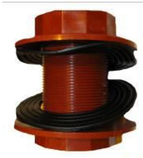
Foto 1. Componentes de la fístula. A. Brida externa; B. Aro de goma externo; C. Brida con rosca interna; D. Aro de goma interno.

2) Dos aros de goma (Foto 1. B y D) de 10 cm de diámetro, el D contacta directamente con la mucosa ruminal, evitando la necrosis del tejido y el B, se coloca en la base roscada exterior (ver Foto 2).