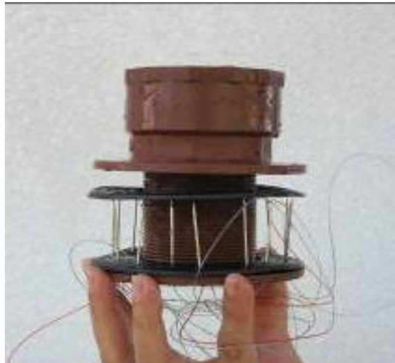
Foto 2. Fístula ensamblada.