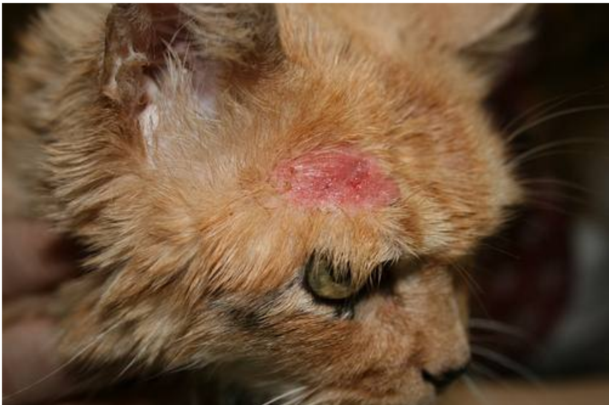
? Figura N°2: Carcinoma de células escamosas: Lesión facial ulcerada. o Squamous cell carcinoma: ulcerated tissue in fatial area.