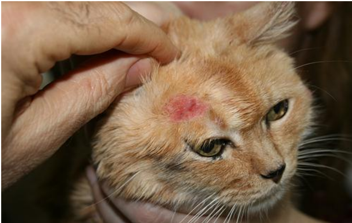
? Figura N° 1: Carcinoma de células escamosas: lesión facial ulcerada. o Squamous cell