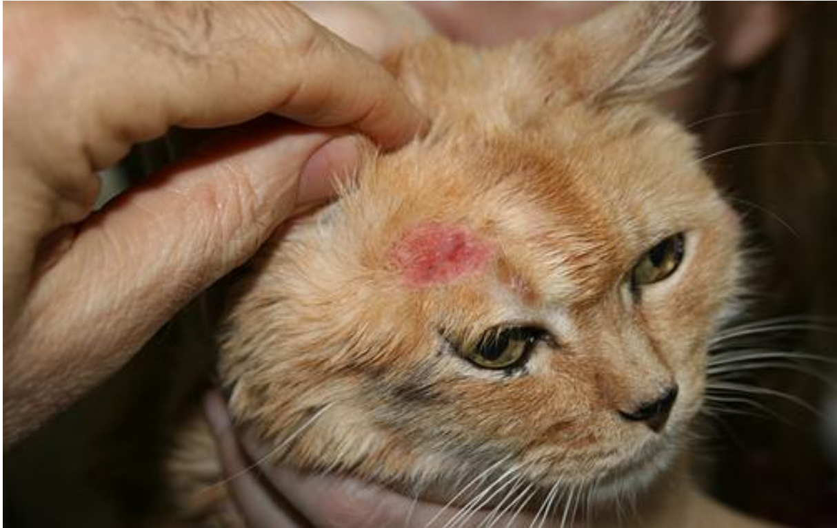
? Figura N° 1: Carcinoma de células escamosas: lesión facial ulcerada. o Squamous cell