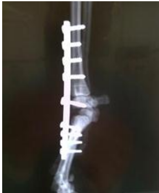
Imagen 4. Caso n° 2.- MAOLITO.

El resultado final fue satisfactorio, aunque persiste una cojera evidente en la extremidad que no compromete la funcionalidad normal de FOX. (Imagen 4).