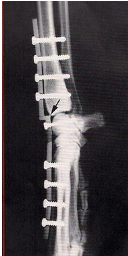
Imagen 10. Por tanto, la utilización de la placa híbrida escalonada, además de producir una artrodesis más fisiológica, permite una deambulación más armoniosa con una cojera menos evidente, lo que la hace la placa de elección para realizar la panarthrodesis carpiana.