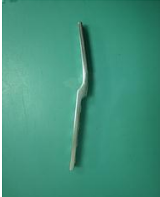
Imagen 3. Métodos y Resultados.