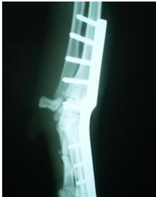
Imagen 8. Conclusiones.

Las placas híbridas DCP producen un desplazamiento craneal de toda la zona distal de la extremidad debido a la distancia entre el hueso carporradial y la placa. Al apretar el tornillo del hueso carporradial, se produce un desplazamiento craneal del mismo con el resultado de un mal contacto entre la zona distal del radio y el hueso en cuestión. (imagen 9) Si