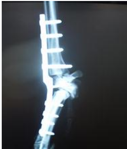
Imagen 6. Caso n° 3.- TOSCA.

Perra de aguas, 5 años. De la misma manera sufre una luxación radiocarpiana postraumática que impide el apoyo de la extremidad.(imagen 7).