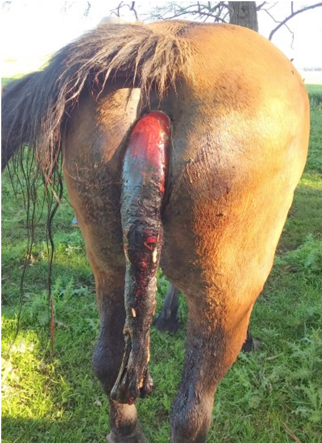
Tremendo prolapso rectal.