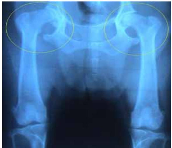
Figura 1. Muestra el diagnóstico radiológico, donde se observa una osteo-distrofia y displasia coxo-femoral. Caso número 1.

Se le prescribió el tratamiento convencional con antiinflamatorio inyectable (Flunixinia Meglumina), durante 4 días, después se continuó con antiinflamatorio oral (Carprofen), conjuntamente con condroprotectores (Glucosamina, Condroitina y vitamina C) por un largo período de tiempo. Dos semanas después de aplicado este tratamiento regresa a la consulta con vómitos y pérdida de apetito, fue internado, se le aplicó hidroterapia conjuntamente con metoclopramida, cimetidina y su del dolor coxo-femoral fue ligera antiinflamatorios. Una semana después indicó aplicar la ozonoterapia por insuflación rectal como se describe anteriormente 20 aplicaciones con 60 mL a 30 mg/L de la MOO. Y se continuó con los condroprotectores.