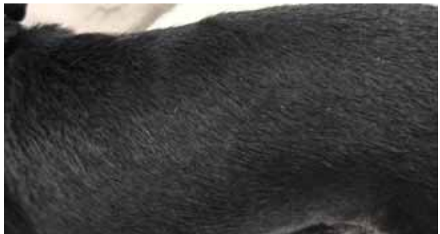
Figura 6. Animal con diagnóstico de Acanthosis nigricans , después del tratamiento la MOO. Caso número 3.

Después de las 12 aplicaciones de la MOO el perro no presentó prurito, ni fetidez, su pelaje demoró aproximadamente 2 meses para reformarse (Fig. 6). Teniendo en cuenta que esta patología es crónica, adicionalmente se aplicó tratamiento con complejo