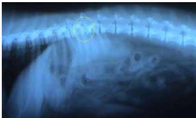
Figura 5. Muestra el diagnóstico radiológico, donde se observa una pequeña calcificación del disco intervertebral T12-T13. Caso número 7.

Este caso presentó intenso dolor y dificultades motoras al examen clínico y el examen radiológico mostró una pequeña calcificación del disco intervertebral T12-T13 ( Fig. 5 ). Se indicó la ozonoterapia por vía rectal y paravertebral. Para la vía rectal se aplicaron volúmenes 20, 25 y 30 mL con concentraciones de 20, 25 y 30 mg/kg respectivamente, se realizó. En la aplicación paravertebral se aplicaron volúmenes de 15 y 20 mg/l, para un total de 8 aplicaciones.