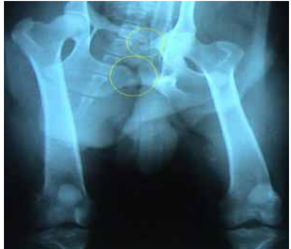
Figura 2. Muestra el diagnóstico radiológico, donde se observa fractura múltiple de cadera ya en proceso de consolidación. Caso número 2.

Esta animal en su examen clínico presentó dolor en los miembros posteriores. El diagnóstico radiológico mostró, fractura múltiple de cadera ya en proceso de consolidación ( Fig. 2 ), por lo que no se prescribió el tratamiento convencional y se indicó directamente la ozonoterapia por la vía de la insuflación rectal, se insuflaron volúmenes de 40, 50 y 60 mL con concentraciones de 20, 30 y 40 mg/L respectivamente, para un total de 20 aplicaciones, cinco semanales.