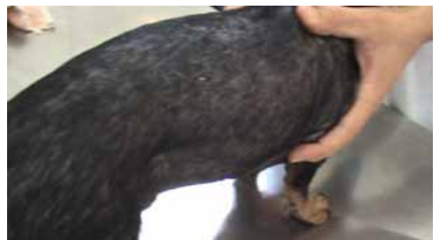
Figura 3. Animal con diagnóstico de Acanthosis nigricans , antes del tratamiento con ozonoterapia. Caso

Después de analizar la historia clínica y los resultados de los tratamientos convencionales, el diagnóstico diferencial demostró la Acanthosis nigricans ( Figura 3 ). Y se indicó la ozonoterapia por vía auto-hemoterapia menor, se aplicó por vía intramuscular un volumen de la MOO mezclada con la sangre de 1,5 mL a concentraciones de 25 y 30 mg/L, se realizó un total de 12 aplicaci